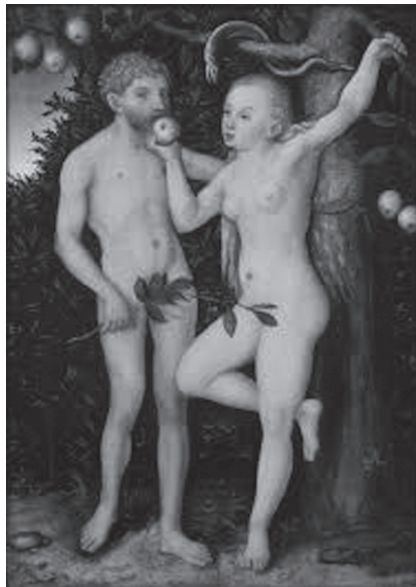
Lucas Cranach l'Ancien, Adam et Ève , 1538.